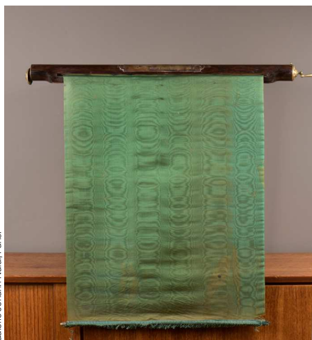
Galerie Johann Naldi, Paris.